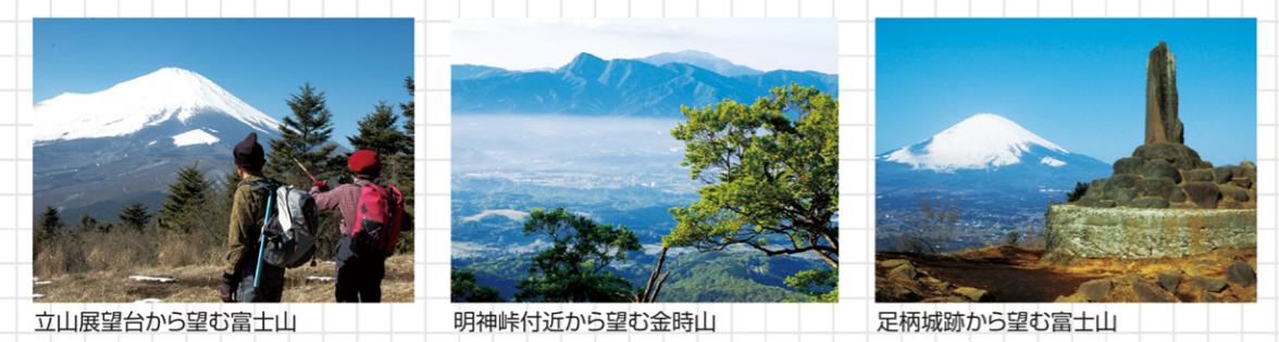
立山展望台から望む富士山 明神峠付近から望む金時山 足柄城跡から望む富士山