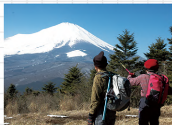
立山展望台から望む富士山