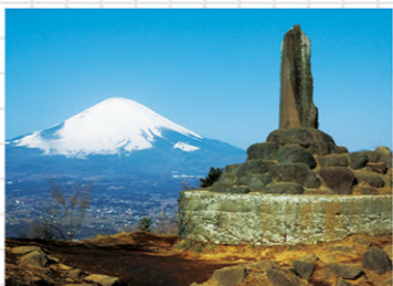
足柄城跡から望む富士山