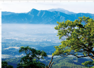
明神峠付近から望む金時山