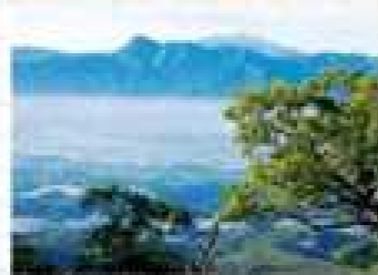
新神村付近から望む金峰山