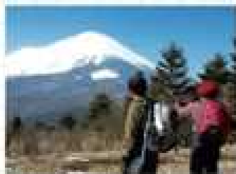
立山展望台から望む富士山